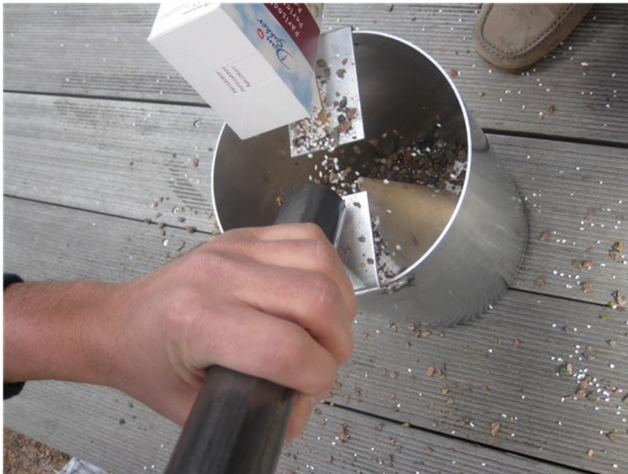
Figur 1 Genomförande av test

Det som främst ska testas är att konens funktion bidrar till att säkerställa en homogen blandning av materialet som matas till stenkrossarna. För att utvärdera konens funktion ska testen omfatta att material av olika storlek får dimpa ner i mitten av konen som ska fördela materialet homogent i silon. Test bör därför göras med material av varierande storlekar samt att det ska vara möjligt att synligt utskilja en homogen blandning i silon. Uppfylls en homogen blandning i silon så kommer krossarna att matas med ett blandat material. Prototyptillverkningen har påvisat att vi valt lämpliga dimensioner då man studerar den färdiga modellen, samt att det verkar rimligt att modellen ska kunna utvidgas 30 gånger till den färdiga produkten. En brist i testet är att det inte kommer att vara möjligt att testa avskiljaren som förser det dubbla transportbanden med material. Detta är inte möjligt eftersom det är svårt att konstruera det vibrerande gallret i så liten skala som prototypen.