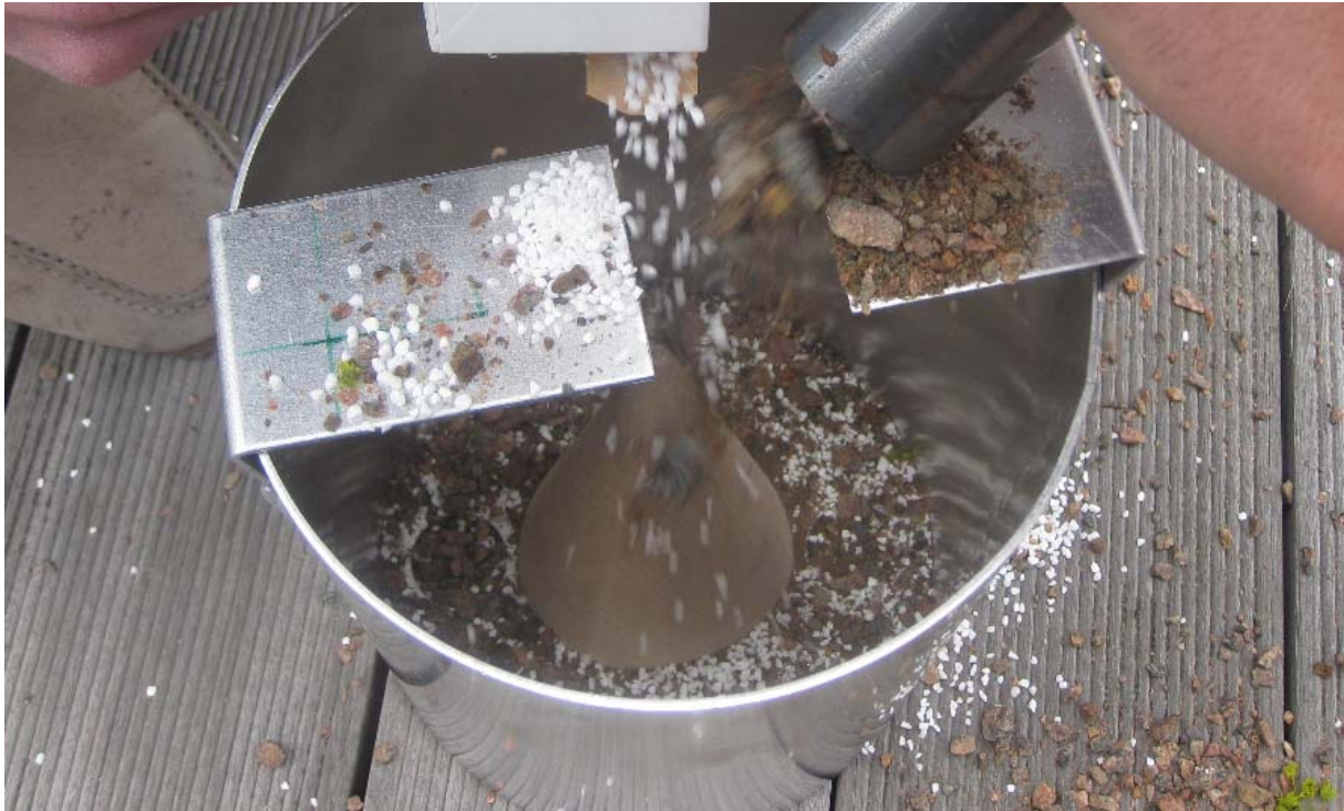
Figur 3 Redovisning av homogen blandning

I figur 3 redovisas fördelningen av simulerat grus inuti silon efter genomfört test. I figuren ses blandningen ovanifrån och man kan få en bra bild på hur stenarna fördelats inuti silon. Konens funktion att fördela ”stenarna” fungerar bra, stenarna faller på önskat sätt vilket leder till att blandningen blir homogen. I de fall som stenarna föll utanför konen blev fördelningen mindre bra. Det är därför av största vikt att transportbandens hastighet styrs noggrant så att stenarna faller mot konens topp.