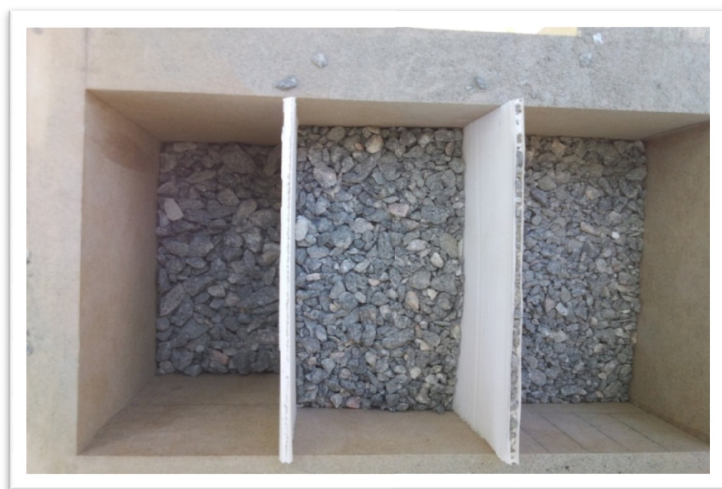
Figur 2. Silning genom grizzlygaller med plexiglasskiva helt införd, från vänster ses fack 3, 2 och 1.

I figur 4 visas hur silon såg ut då det inkommande materialets fördelning mättes. Vidare i tabell 2 redovisas den procentuella volymfördelningen mellan de olika storleksdefinitionerna. Denna mätning användes sedan som jämförelse för det utgående materialet.