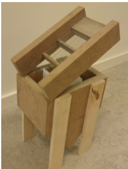
Figur 2 Isometrisk vy över färdig prototyp