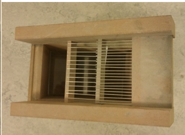
Figur 3 Vy av prototypen ovaifrån